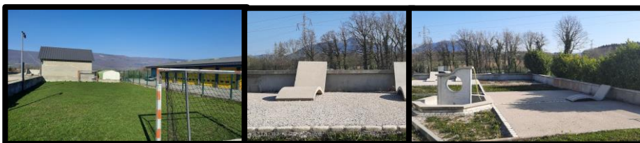
Lieux de détente