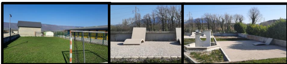
Lieux de détente