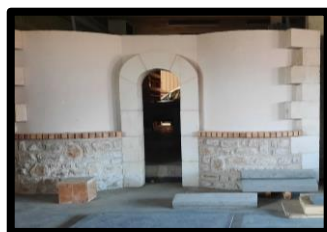
Les ateliers, matériels, engins en fonction du métier préparé