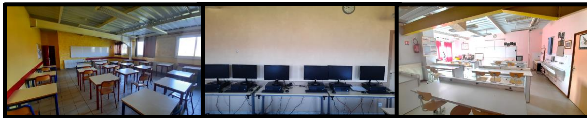
Les salles de cours